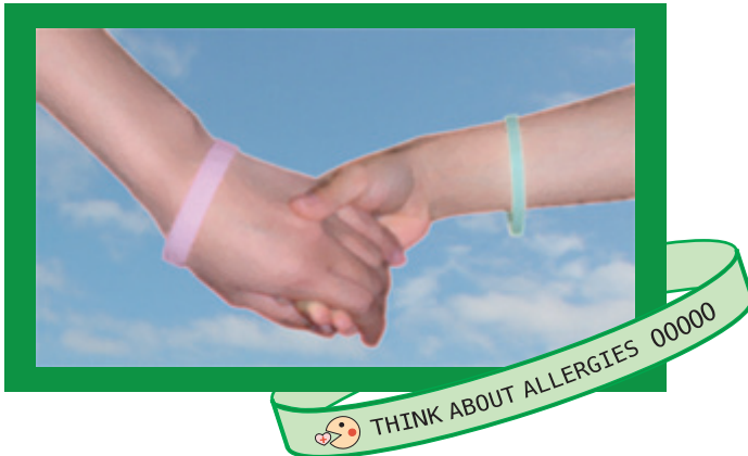
< データ登録シリコンバンド >